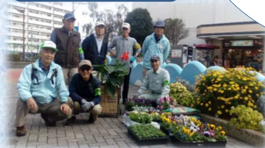
・鴨居駅周辺の公園美化