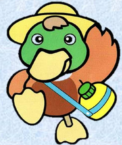
まち研のキャラクター「カモピー」